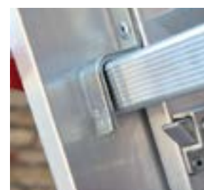
Specjalny element zabezpieczający przed rozłączeniem. Special unhook safety device