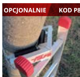
OPCJONALNIE KOD P8 Optional pole support