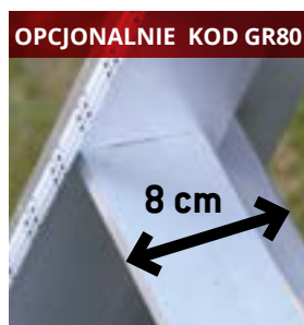
OPCJONALNIE KOD GR80 Stopnie o szerokości 8 cm 8 cm wide rungs