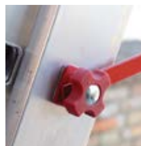
Specjalne zabezpieczenie zapobiega rozsunięciu. Special anti-opening device.