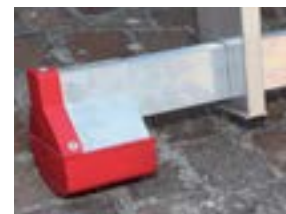
Nowa podstawa stabilizująca New stabilizer base.