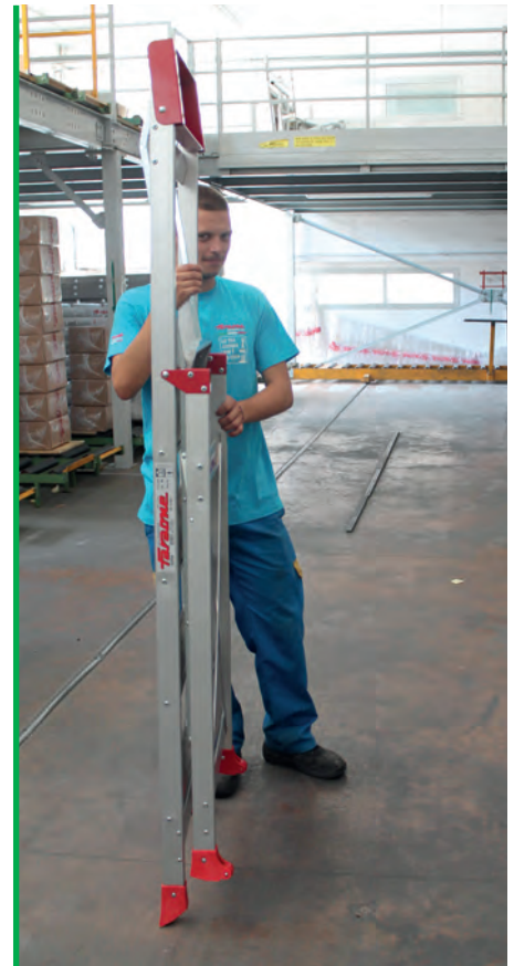
Złożone schody SGP zajmują niewiele miejsca. The SGP step ladder occupies very little space when closed.