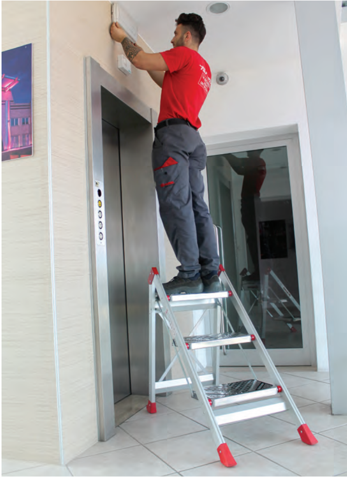
Uniwersalny w każdej sytuacji, gwarantuje stabilność i bezpieczeństwo.

Versatile in any situation, it guarantees stability and safety.