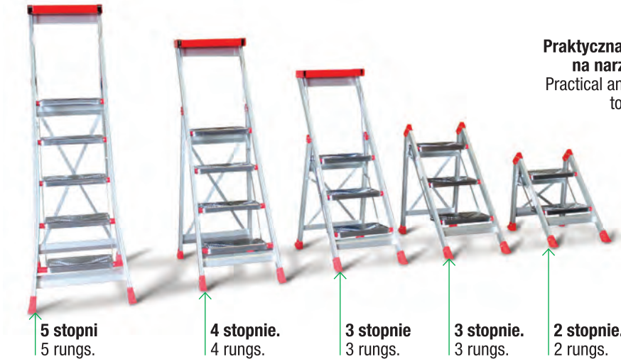
Praktyczna półka na narzędzia. Practical and solid tool bag.